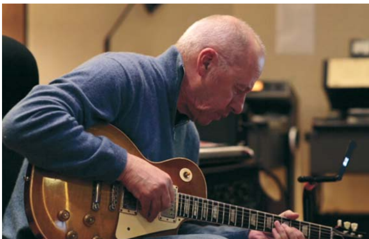
Mark Knopfler wystąpi 13 lipca na krakowskiej Arenie

13 lipca krakowska Arena rozbrzmi głosem i dźwiękami mistrza gitary Marka Knopflera, podczas którego koncert poza klasykami z dorobku Dire Straits, usłyszymy solowy repertuar artysty (któremu towarzyszyć będzie siedmioosobowy zespół) w tym piosenki z nadchodzącego albumu